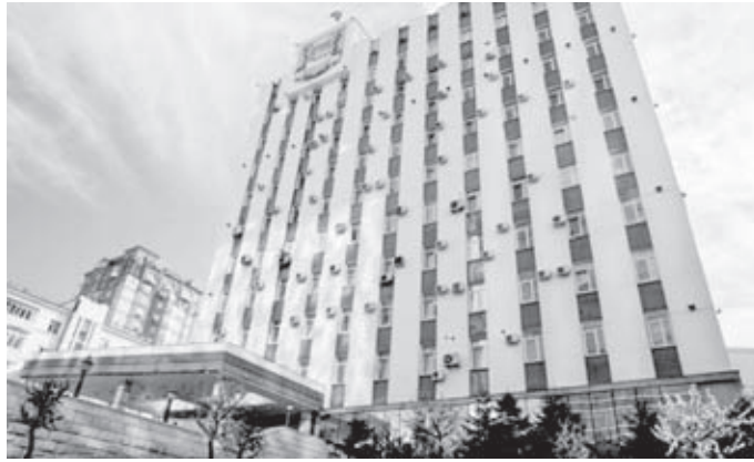
городской администрации vlc.ru в разделе: Главная / Экономика / Бюджет для граждан / Проект бюджета Владивостокского ГО.

С проектом решения Думы города Владивостока «О принятии муниципального правового акта города Владивостока «О бюджете Владивостокского городского округа на 2024 год и плановый период 2025 и 2026 годов» можно ознакомиться на сайте