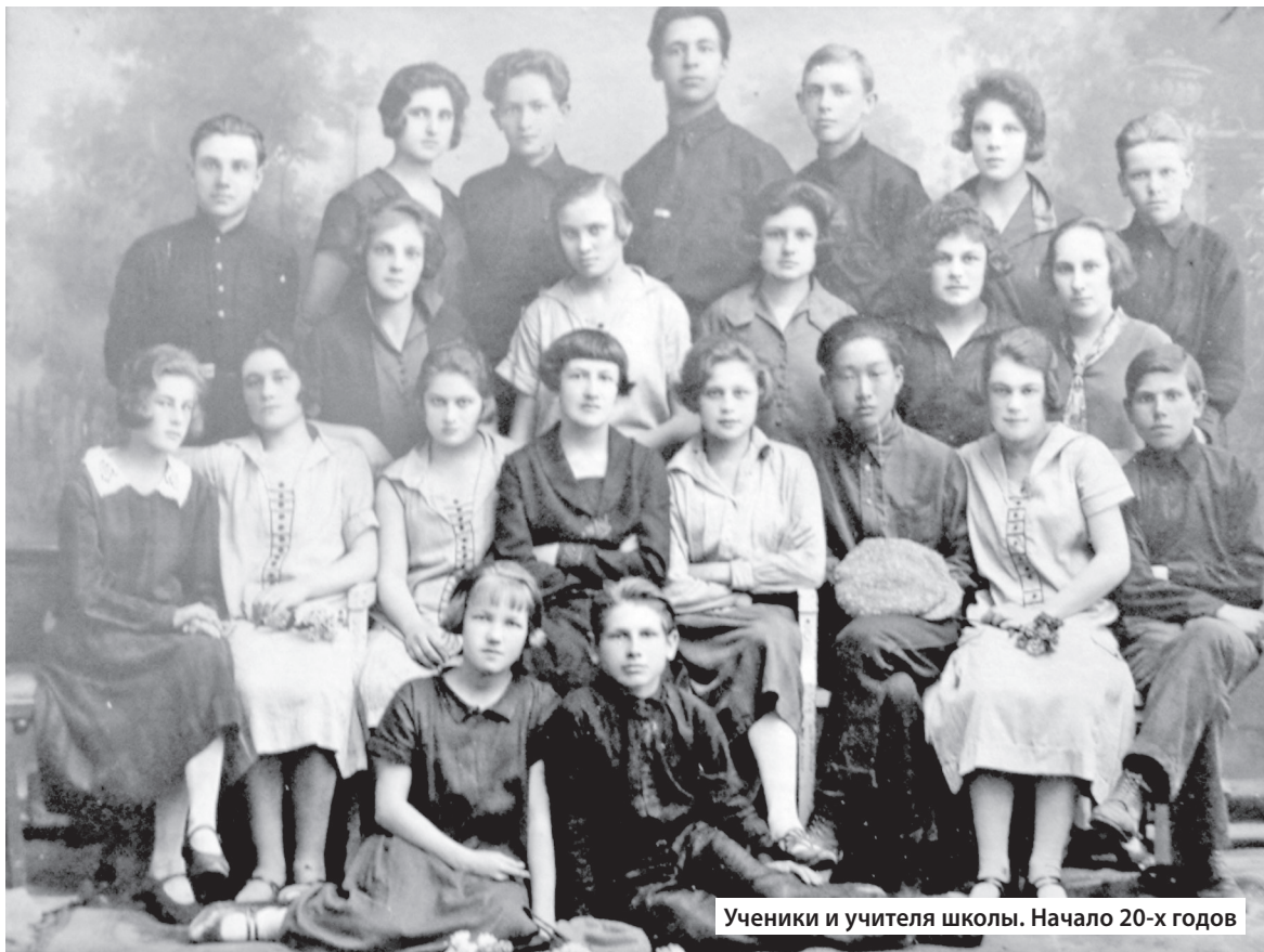
Ученики и учителя школы. Начало 20-х годов

Директор непременно тебя выслушает, даст совет, если надо.