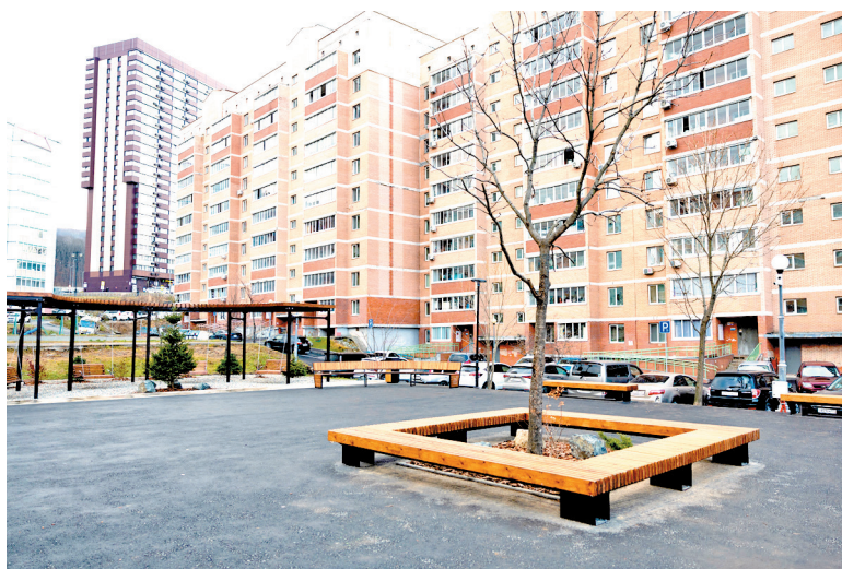
Благоустроенная площадка на ул. Анны Щетининой, 9