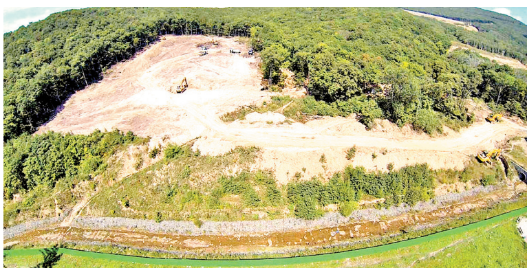
Снеговая Падь, 2015 год ▲