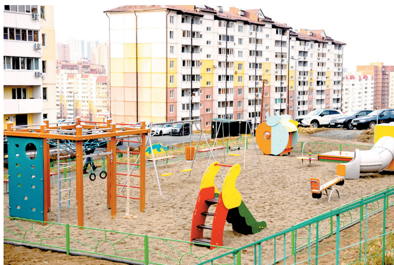
Детская площадка на ул. Адмирала Горшкова, 71