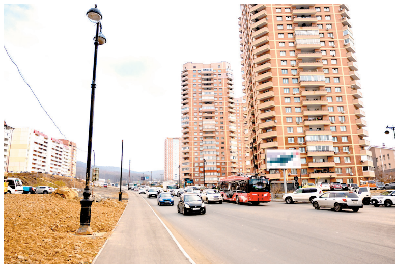
В микрорайоне проходит ремонт дорог

О модернизации динамично развивающегося микрорайона в городе и не только