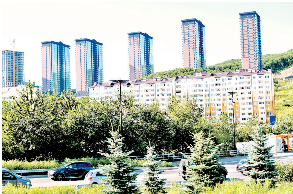
В 2025 году микрорайон значительно преобразился ▲