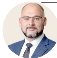
Константин ШЕСТАКОВ, глава Владивостока:

— На сегодняшний день муниципальное предприятие «Содержание городских территорий» полностью подготовлено к вызовам зимы и ведет планомерную работу по устранению последствий непогоды. На обслуживании у МБУ «СГТ» находится почти 828 километров дорог, которые ежедневно и круглогодично убирают вручную и с помощью спецтехники.