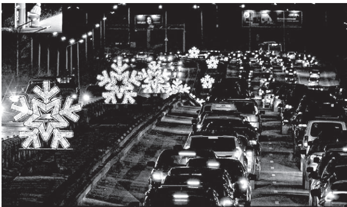
Олеся БРАГИНА

К Новому году во Владивостоке смонтируют более 800 элементов праздничной иллюминации, и город традиционно станет одной из самых светлых точек на карте Дальнего Востока в зимние праздники.