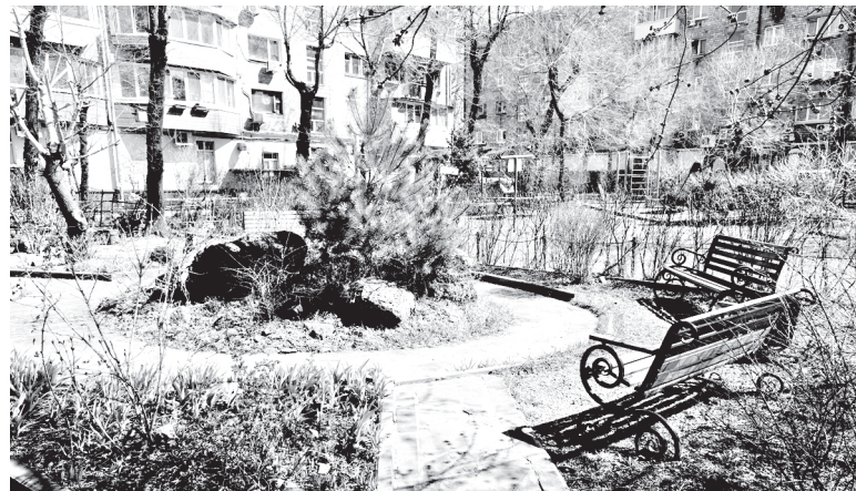
ТОС «Военное шоссе»

Жители микрорайона, организованные ТОС, делают окопные свечи, шьют одеяла, другие постельные принадлежности, покупают тапочки, полотенца, средства гигиены, медицинские препараты. На Военном шоссе живут семьи, чьи мужчины ушли на СВО, поэтому и этим